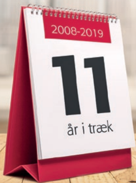
Voxmeter, januar 2020

Danmarksgade 67 | frederikshavn@al-bank.dk